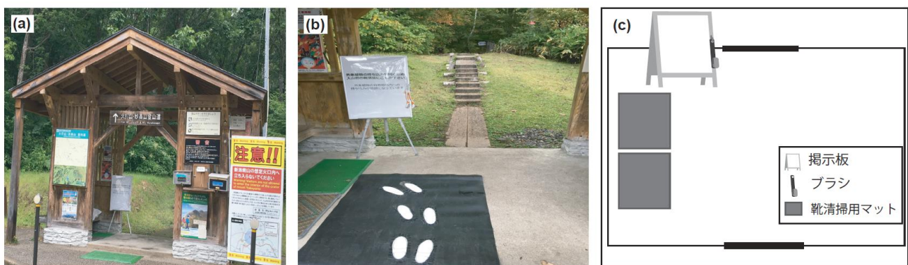
図 1: 調査設定の概要。(a)調査した火打山・妙高山登山口、(b)靴清掃ツール(ブラシ、マット)と掲示板、足跡を描いたゴムシートの設置状況、(c)靴清掃ツールと掲示板の配置見取り図

本成果は生物多様性の保全のための行動変容に対してナッジが有効であり、その有効性の程度には個人の特性が関わっていることを示した初めての事例となります。今後、他の生物多様性保全に関わるナッジを含む行動変容策の有効性の検討や、そのような対策の効果を変動させる個人の特性に対する理解を深めることが、人々の行動を変容させ生物多様性の減少を抑制する上で欠かせません。